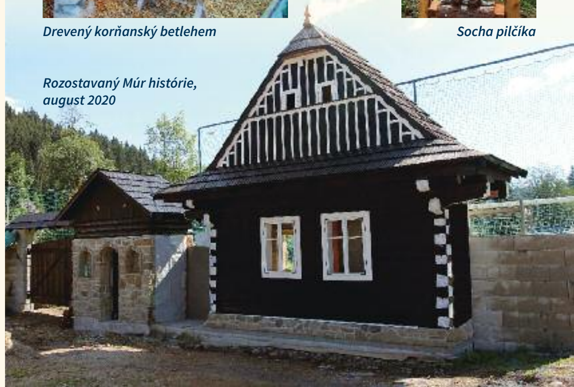
Rozostavaný Múr histórie, august 2020