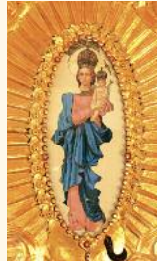
Milostivý obraz Panny Márie, ktorý za minulého režimu chceli spáliť, ale obraz akoby zázrakom odolal plameňom.