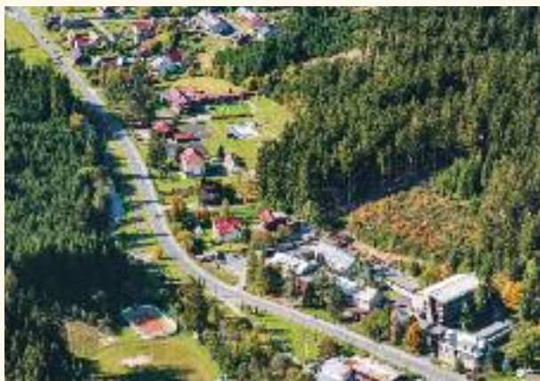
Pohled na kostel a centrum obce

Rozloha obce Bílá je 56,524 km 2 , počet obyvatel dle Českého statistického úřadu k 1. 1. 2020 je 281. V současnosti je Bílá zejména významným turistickým centrem, obec protíná množství turistických i cyklistických tras.