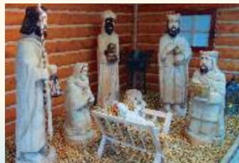
Drevený korňanský betlehem

V centre obce, vedľa hlavnej cesty v blízkosti kostola, si návštevník môže všimnúť netradičnú pamiatku – Múr histórie, ktorý symbolicky zobrazuje starú kysuckú dedinu. Časti dreveníc, z ktorých je Múr histórie postavený, pochádzajú z pôvodných dreveníc Korne a vedľajších obcí. Ide o unikátny spôsob spojenia záchrany historického dedičstva a architektúry Kysúc. Staré stavby – drevenice či pivnice, ktoré užívali naši predkovia, už zub času poznačil natoľko, že boli určené na demoláciu. No autori a realizátori Múru histórie zachránili pôvodné časti kysuckých dreveníc či pivníc a vytvorili toto hodnotné a originálne dielo. Zároveň vytvorili ďalšiu z atrakcií obce Korňa i Kysúc.