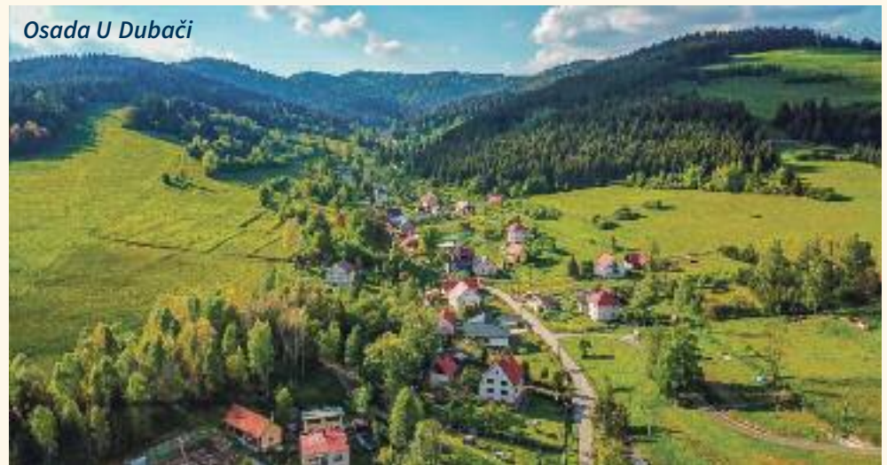
Osada U Dubáči