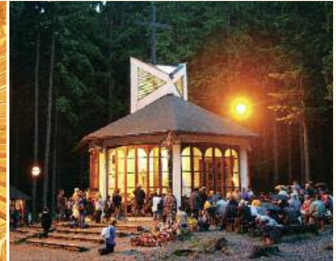
Večerná adorácia pri Kaplnke Panny Márie Kráľovnej pokoja približne v roku 2005.