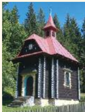
Kaple sv. Cyrila a Metoděje na Hlavaté (post. 1924), připomínající díla architekta D. Jurkoviče na Pustevnach

Kostel sv. Bedřicha postaven v letech 1873 – 1874 a inspirován severskou architekturou náleží v regionu k historicky nejmladším.