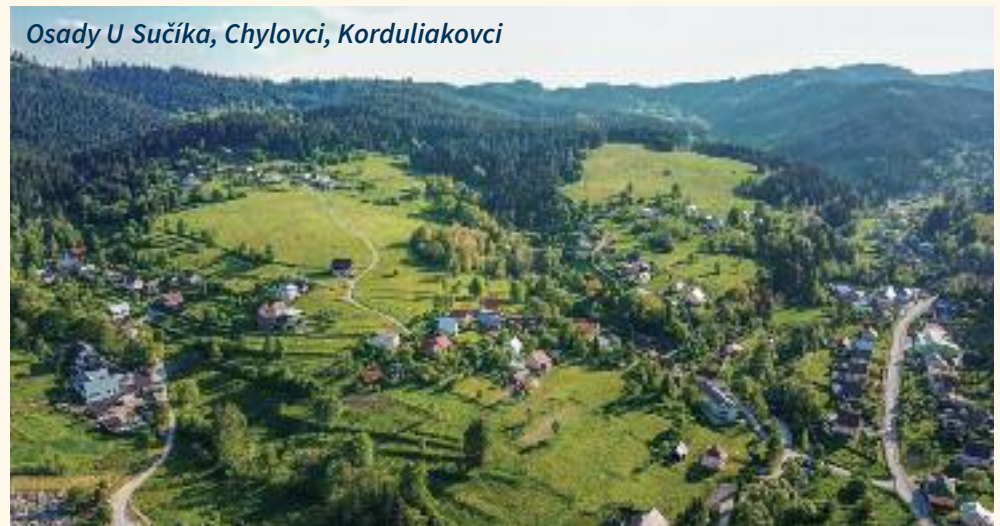
Osady U Sučíka, Chylovci, Korduliakovci

V Korní ako súčasť turzovskej farnosti bol postavený nový Kostol Božského Srdca Ježišovho (1994) a v roku 2000 bola Korňa ustanovená samostatnou farnosťou. Predchodcom súčasného kostola bol drevený kostol, dnes slúžiaci ako pastoračné centrum. Jednotlivé časti obce sú síce od seba vzdialené, čo robí obec Korňu rázovitou horskou obcou, avšak farský kostol ako srdce obce spája jej jednotlivé časti i jej obyvateľov, ktorí ho radi navštevujú.